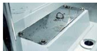
. . . und ebenso der Kiel.