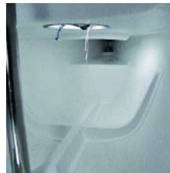
Der Bug ist abgeschotet, auf die Spanten kann man Grätings zum Liegen legen.