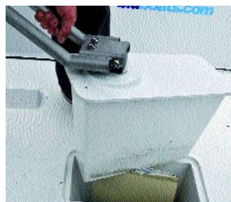
So einfach lässt sich das Ruder herausnehmen . . .