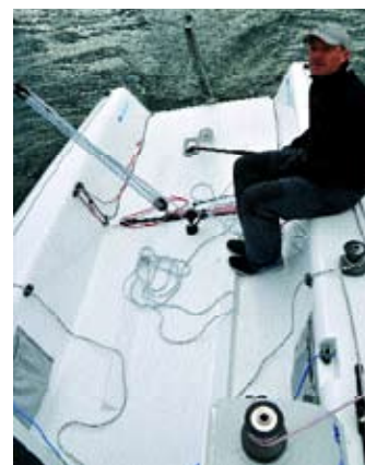
Aufgeräumt und bequem ist das Cockpit.