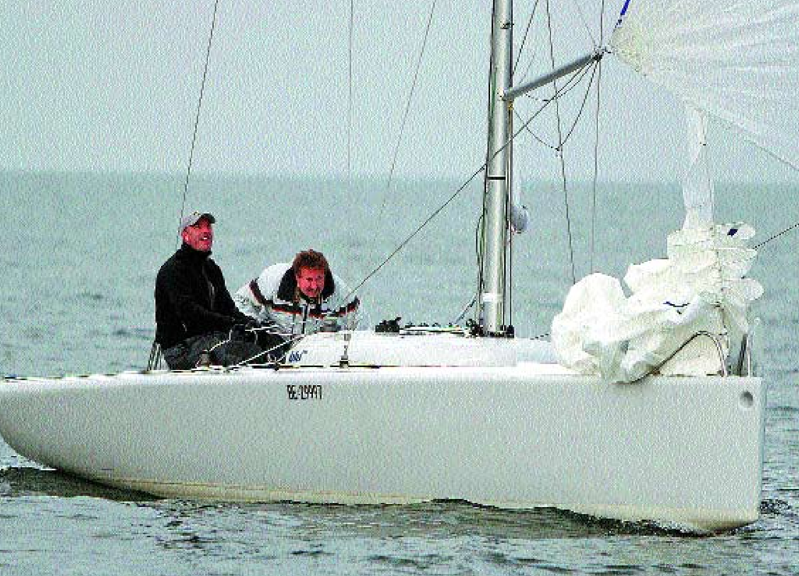
Elegant und schnell ist die Blu 26, sie überzeugt zudem mit einer guten Stabilität.

sich nicht im unpassenden Moment und schlägt keine Schrammen, weder am Boot noch im Eifer des Gefechts am Kopf der Crew. Die Beschläge von Ronstan sind genau ihrem Zweck entsprechend dimensioniert. Mit diesem Konzept hat die Blu 26 die Herzen der Match Racer in St. Moritz erobert, die neben den Segeleigenschaften ihre gute Handhabung loben.